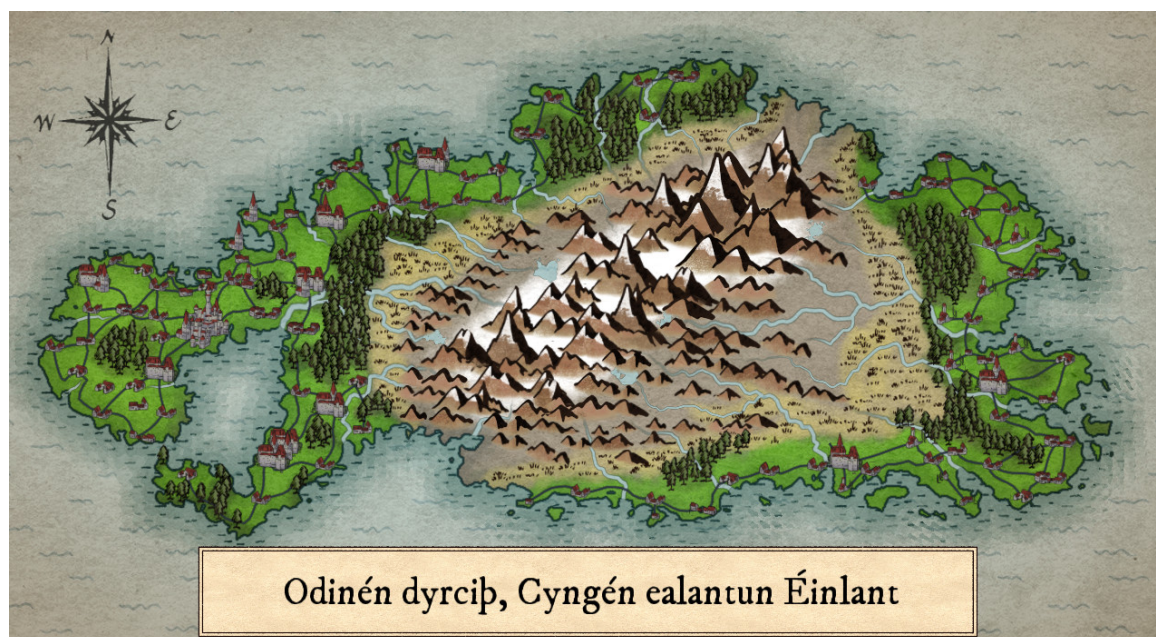
Figure 1.1: Carte du XIX ème siècle d'Éinlante

à véritablement s'implanter, la religion nordique païenne restant largement dominante jusqu'au XIX ème siècle où un déclin rapide des diverses religions aura lieu. De nos jours, la population d'Éinlante est à environ 68% païenne, 15% athéiste, 9% de sa population suit une des religions monothéistes (principalement le Protestantisme et le Chistianisme), 6% bouddhiste et 2% de la population suit des religions diverses (Hindouisme, Chamanisme,...).